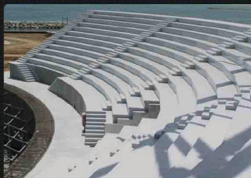
Stadion - Griekenland