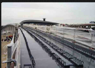
Brug - Frankrijk