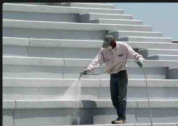
Stadion - Griekenland